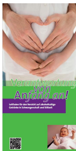
(Deckblatt zur Broschüre „Verantwortung von Anfang an!“)