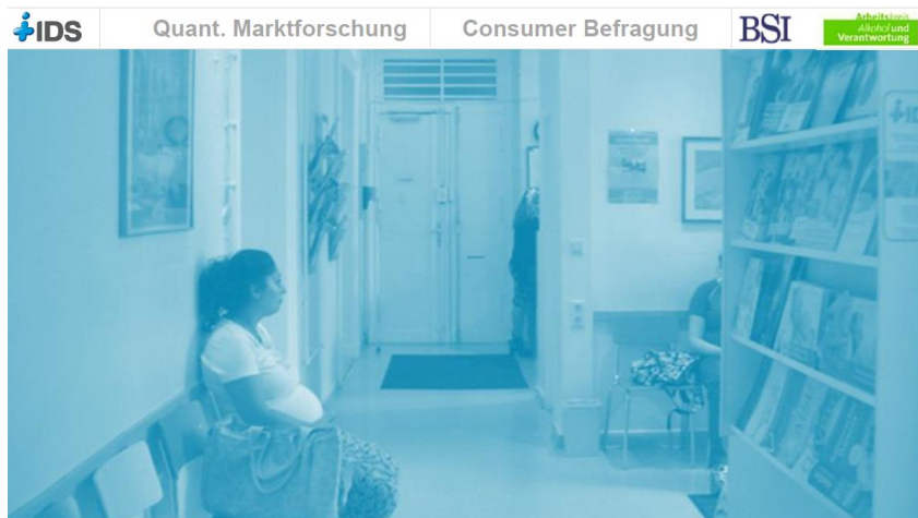
(Deckblatt zur Evaluierung von IDS 2024)